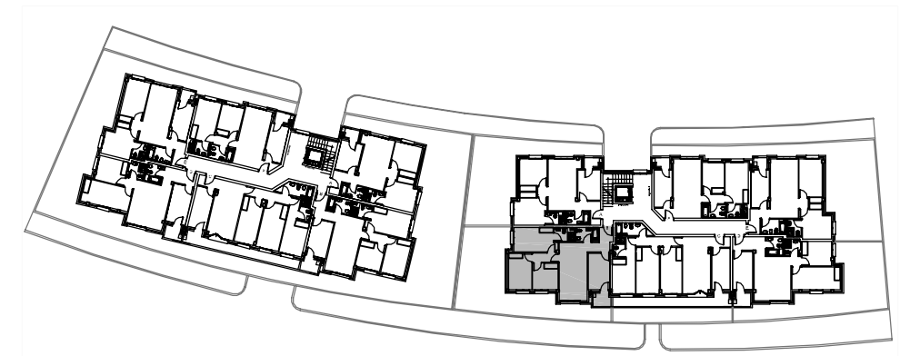
SUPERFICIES UTILES APROXIMADAS